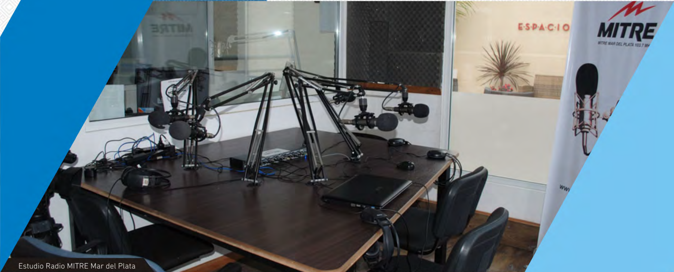
Estudio Radio MITRE Mar del Plata